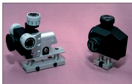
Im Test verwendet: Links das neue Insight-Out-Diopter, rechts das Walther Standard-Diopter – beide wurden für das Foto auf die ebenfalls verwendete Visierlinienerhöhung Centra Block Club gesetzt.

Klare Vorteile also gegenüber den LG-300-Systemen, und damit ist auch ein langjähriger Kritikpunkt fast weggefallen. Allerdings nur fast – denn ausgerechnet die Basic-Version kommt ohne Ladestandsanzeige – zwar kostengünstiger – aber gerade für die Zielgruppe der Einsteiger mit weniger Erfahrung unverstündlich. Dagegen ist der Verzicht auf andere Ausstattungselemente wie den „Equalizer“ bei diesem Modell durchaus angebracht. Übrigens: Das 400er-Modell übernimmt die Aluschaft- und Anatomic-Schichtholzversionen, die bewährten 300-XT-Systeme bleiben künftig den klassischen und preiswerteren Holzschaffmodellen vorbehalten. Die Produktion des Karbonschaftmodells 300 XT wird eingestellt,