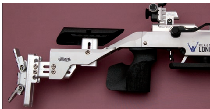
Der Hinterschaft und die Systemaufnahme von rechts – vorn der neue Abzugszüngel nebst Bügel und das Insight-Out Diopter, hinten die Backen- und Kappeneinstellung. Und für Detailfreunde ist die Zahlenskalierung auf den Auslegern sichtbar.

3-D-Pistolengriffes aus der Fürstenberg Produktion nicht ganz, die Oberfläche wirkte glatter als erwartet. Auf die Gestaltung von Vorderschäften und deren Erhöhungen bin ich bereits in der vorherigen Ausgabe der DSZ ausführlich eingegangen. Nun, auch die Competition-Erhöpfung liegt im Trend: Das starre „Brettel“ selbst baute flach und breit und per Distanzstücken maximal bis zu 25 Millimeter hoch. Diese Formgebung favorisierte die Handlage auf der Faust, für andere Stützhandhaltungen ist sie bei kleinen und mittleren Händen zu breit. Dafür zeigte die Pro-Touch-Beschichtung ihre erwartete Wirkung.