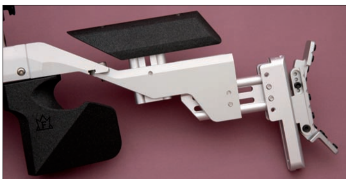
Der Hinterschaft des LG 400 Competition von links – auf dem Pistolengriff mit Pro Touch Lackierung ist das Herstellerzeichen der Firma Fürstenberg deutlich zu sehen.