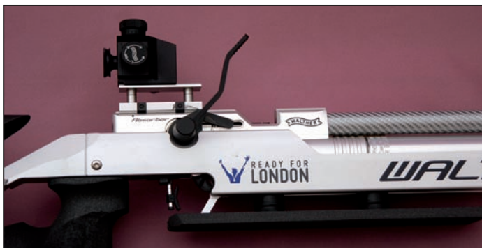
Detailfoto des Basic Diopter.

ab, während die Schraube des 30 Gramm Laufgewichtes Druckstellen an der jetzt abgerundeten Tube produzierte, und den durchaus geräumigen Kunststoffkoffer finde ich immer noch unpraktisch zu öffnen. Aber dies sind, wie gesagt, Kleinigkeiten.