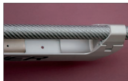
Der Aluträger bietet reichlich Platz für Zusatzgewicht wie hier im Vorderschaft. In der Laufverbindung ganz vorn ist der weiße Kunststoffring zum Schutz der Kassette sichtbar.

Für den DSZ-Test stand ein LG 400 in der COMPETITION Ausführung zur Verfügung. Also starrer Vorderschaft, Hinterschaft-Elemente entsprechend des BASIC mit Schnellverstellung, sowie die Visierung auf Topniveau. Am Testgewehr montiert war das neue Insight-Out-Diopter, alternativ stand auch noch das Basic-Diopter zur Verfügung. Ebenfalls gesondert geordert wurde die Visierhöhung Centra Club. Diese wurde für den Test aus der Schulter ebenso montiert wie das einstellbare Ringkorn.