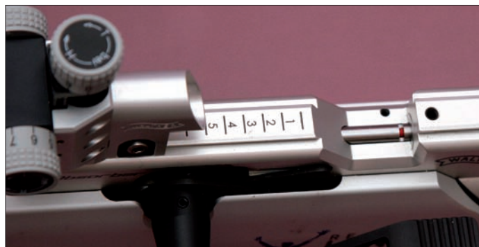
Das LG 400 Ladesystem zeigt den aktuellen Ladezustand visuell an – per roter Markierung im Zuführungsstößel.