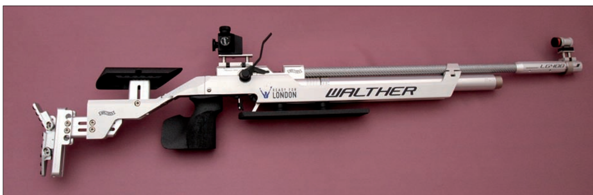
Das Walther LG 400 Alutec COMPETITION mit Insight-Out-Diopter, Visierlinienerhöhung und einstellbarem Ringkorn von Centra. In dieser Ausstattung absolvierte es den Testbetrieb aus der Schulter.

Ausführung oder das Centra Score, beides mit 18 Millimeter „Durchblick“. Ebenso vertraut das Walther Basic-Diopter, neu das Insight-Out-Modell, das trotz deutlich verändertem Design seine Abstammung aus der Hämmleri-Erbmasse nicht verbirgt. Das neue Diopter nutzt eine kugelgelagerte Schienenführung zur Korrekturstellung der Irisblende. Das ist reibungsarm und damit präzisionsfördernd, als besonderer Clou ist die Seitenkorrektur beidseitig