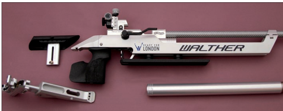
Das Walther LG 400 Alutec mit demontiertem Hinterschaft – Fischertechnik für Luftgewehr-Schützen.

Letztlich wird damit die bewegte Masse verringert und damit die fühlbare Erschütterung bei der Schussauslösung.“ Dies und die Neugestaltung des Absorbers zur Sprungreduzierung – bei Walther jetzt „Equalizer“ getauft – sorgen für verringerten Verbrauch und damit nochmals für eine Erhöhung der ohnehin schon nicht geringen Schusskapazität der Vorratskassette. Letztere jetzt übrigens aus Alu mit silbern eloxierter Oberfläche.